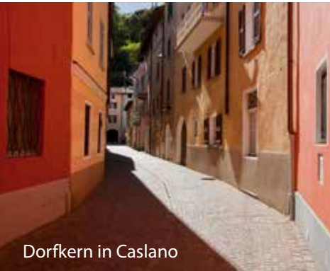
Dorfkern in Caslano